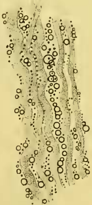
Fig. 2. Stück aus dem Halsteil derselben Form. In den Muskelfasern keine Tropfen.